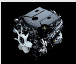
Motor 1GD (2.8l) - 163 CV

*Diésel con contenido de azufre menor a 10 ppm. **Toyota Safety Sense, integra diferentes sistemas de seguridad activa que pueden variar según cada modelo y/o versión. A su vez, estos sistemas están diseñados para asistir al conductor, no para sustituirlo. El conductor debe mantener en todo momento el control de su vehículo y es responsable de su conducción, por cuanto estos sistemas no reemplazan la conducción segura. El correcto funcionamiento del Toyota Safety Sense y de los distintos tipos de sistemas que equipa, depende de muchos factores incluyendo las condiciones del camino, el clima y el vehículo, razón por la cual el/los sistemas podrán verse afectados u obstaculizados debido a factores externos, no siendo Toyota Argentina S.A. responsable de las consecuencias derivadas del uso del sistema. Para más información sobre Toyota Safety Sense, dirigirse a la web toyota.com.ar o consulte el manual de usuario. ***Disponible solo por conexión USB. Verifique la compatibilidad de tu modelo con el fabricante.