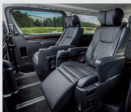
Segunda fila de asientos con regulación eléctrica y calefaccionados