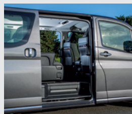
Puertas traseras laterales con apertura eléctrica